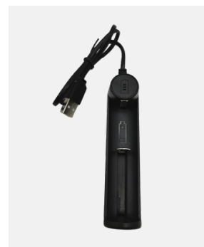
USB-LADEGERÄT Für Akku Typ 18650