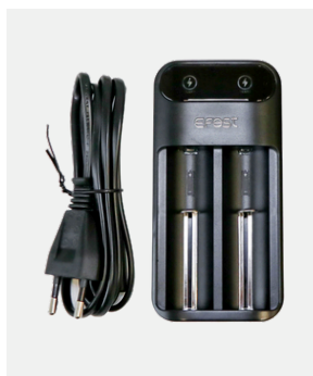
LADEGERÄT für 2x Li-Ion-Akku (Ladezeit 4 Std.)