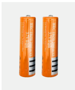
2 X 18650 ERSATZ-AKKUS Art. 264 Passend für MR 96 E